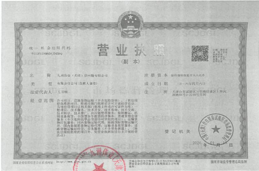
附件 2：三家公司营业执照、资质证书及二次报价表